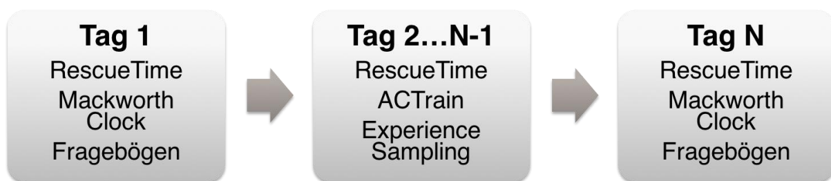
Abbildung 2: Schematischer Ablauf der Feldexperimente mit ACTrain. Die enthaltenen Fragebögen werden ebenfalls computerbasiert dargeboten.

Das in der Software enthaltene Experience Sampling Modul ermöglicht es uns, den Einfluss des Feedbacks auf die Selbstkontrollfertigkeiten der Nutzenden zu untersuchen. Dazu fragt ein in unregelmäßigen Abständen eingeblendeter Dialog unter anderem die wahrgenommene Stärke und Widerstandskraft gegenüber aufgabenfremden Verlockungen ab. Darüber hinaus erfasst die Self-Control Scale (Tangney et al., 2004) die selbsteingeschätzten Fertigkeiten der Nutzenden in dieser Dimension.